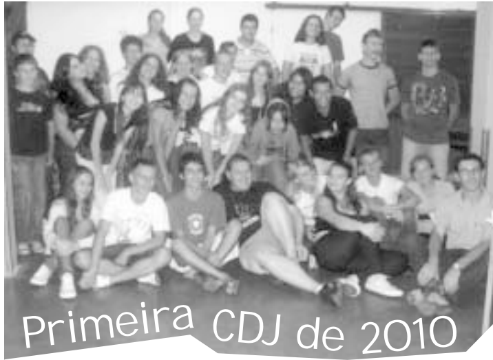
Primeira CDJ de 2010

Nos dias 13 e 14 de março, aconteceu a primeira reunião da Coordenação Diocesana de Jovens (CDJ) do ano de 2010, na comunidade Nossa Senhora da Consolata, Bairro Koller, Erechim. Vários jovens estavam presentes, das mais diversas paróquias da diocese, entre eles o grupo JBC da mesma comunidade.