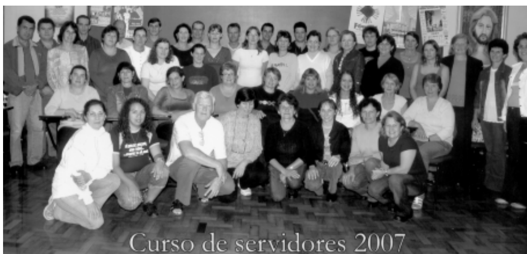
Turma 2007 no Centro Diocesano de Pastoral

Em Jacutinga continua a turma que iniciou no ano passado e que concluirá na metade deste ano. Esta, faz parte da área de Jacutinga, que compreende as paróquias de Jacutinga, Barão de Cotegipe, Paulo Bento, Campinas do Sul e Entre Rios do Sul. No momento, estão estudando temas ligados à Liturgia e aos Sacramentos.