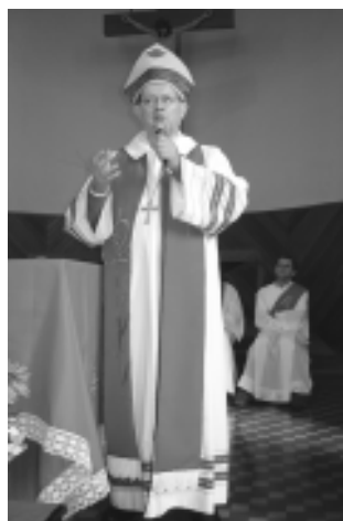
Presidindo a missa do seu aniversário