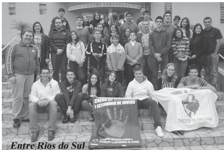
Entre Rios do Sul

Com muita música, teatro e diversão, a nossa diocese mostra um pouco mais do projeto de vida de Deus para toda a juventude.