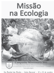
Da Medalha do Mês - Círculo Nacional - 22 e 23 de agosto

A. /: Bendito sejas, ó Pai criador, Pai santo e Senhor, Bendito sejas!:/