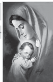
Santa Mãe de Deus