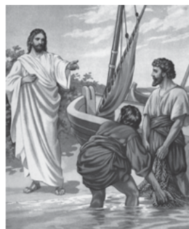
“Segui-me e eu farei de vós pescadores de homens”.

A. Bendito seja Deus que nos reuniu no amor de Cristo.