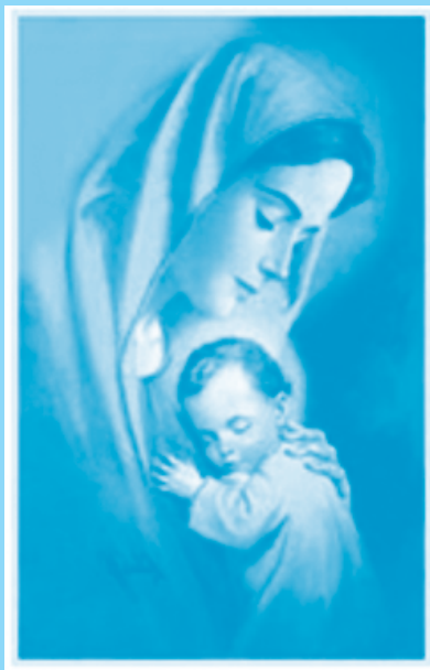
Santa Maria, Mãe de Deus!