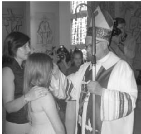
Dom Girônimo Zanandrea confere o Sacramento da Crisma a adolescentes e jovens, no dia 25 de novembro, na Catedral São José.

Durante o mês de novembro, entre outras, Dom Girônimo realizou as seguintes atividades: crismas em dez paróquias diferentes; reunião dos padres e diáconos, no dia 14; participação na VI Assembléia Regional da Pastoral Familiar, nos dias 18 e 19, em Porto Alegre; participação na reunião do CONSER - Conselho Episcopal Regional (bispos do RS). Em dezembro, haverá