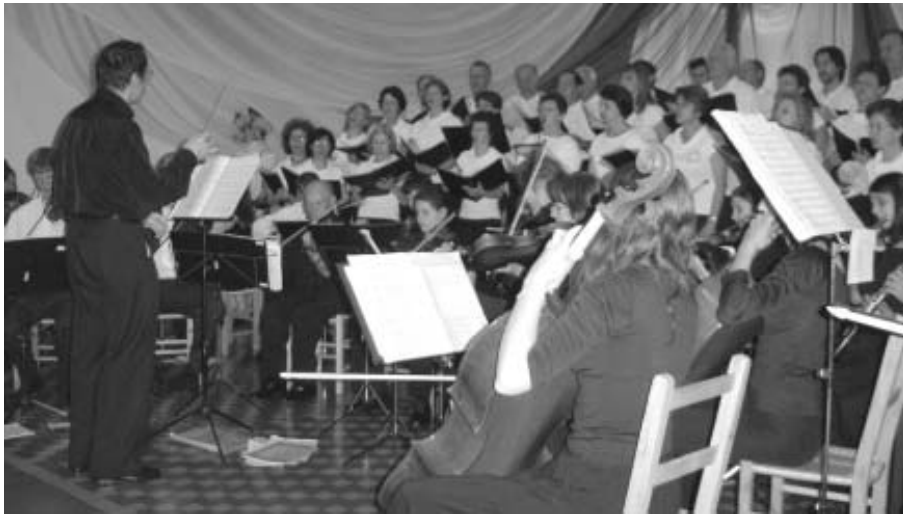
A orquestra é formada, em sua maioria, por jovens.