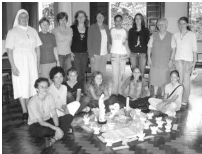
O encontro teve lugar no salão do Seminário Nossa Senhora de Fátima.

O dia 25 de novembro, sábado, no salão do Seminário de Fátima, as Assessoras da Infância e Adolescência Missionárias fizeram seu encontro de avaliação e planejamento. Iniciamos o encontro com oração e uma reflexão sobre o Advento e a necessidade de preparar bem a festa do Natal, cujo objetivo maior é celebrar o nascimento de Jesus. Proporcionar às crianças da Infância Missionária um bom envolvimento nos encontros e encenações de Natal.