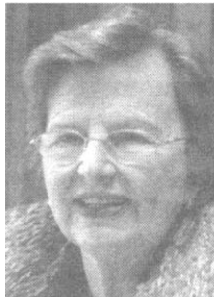
Zilda Arns Neumann