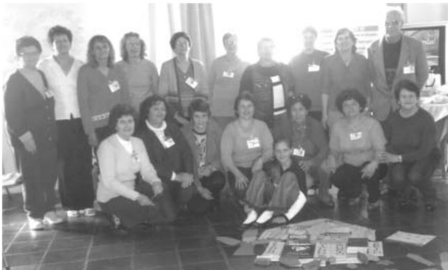
Grupo de agentes da Pastoral da Pessoa Idosa da Paróquia Nossa Senhora da Salette, Bairro Três Vendas, Erechim.