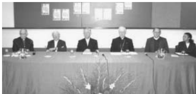
Sessão solene de lançamento do Diretório Nacional de Catequese.

O capítulo quarto destaca a Palavra de Deus, transmitida na Escritura e na Tradição, como fonte da catequese. Uma outra