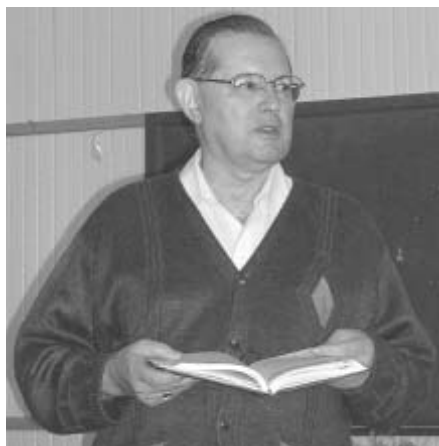
Dom Girônimo anuncia as transferências de padres.

Por ocasião do final de ano, é normal e até rotineiro que o Bispo Diocesano realize novas nomeações e transferências de sacerdotes do seu Presbitério. Ao comunicar essas nomeações e transferências, destacamos mais uma vez que o Bispo é assessorado por um Conselho de doze padres (Conselho de Presbíteros) e que sempre faz as transferências motivado, única e exclusivamente, para o bem da Diocese, em benefício do povo da Paróquia, ou para o bem do próprio sacerdote. Por isso, no momento, os padres provisionados com novos ofícios eclesásticos são os seguintes: