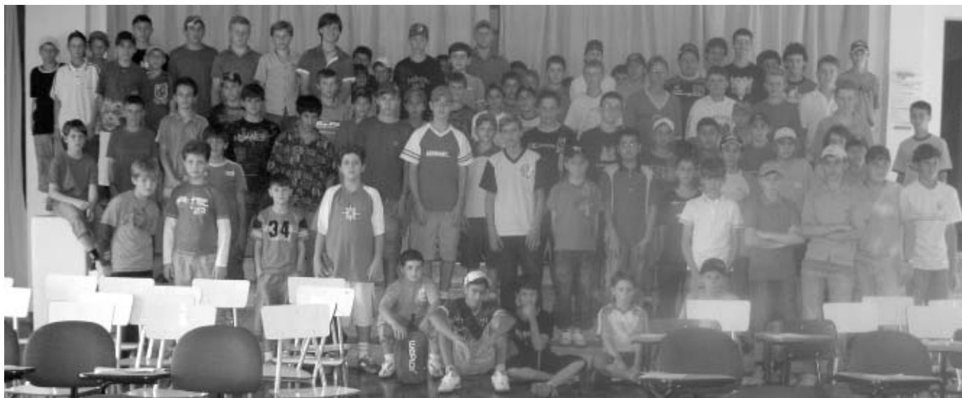
O primeiro turno reuniu alunos de 5ª, 6ª e 7ª séries.

O Seminário é um bom lugar de se viver, aprender e crescer na vida.