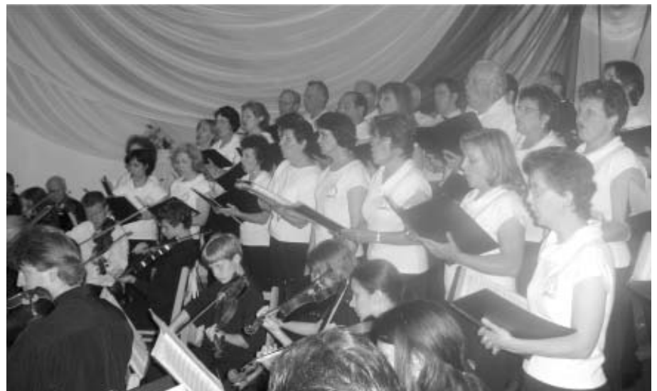
O Coral Nossa Senhora de Fátima é formado por leigos e leigas das comunidades de Erechim.

através dos dons concedidos gratuitamente ao ser humano.