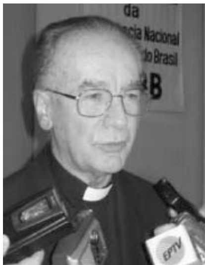
Cardeal Cláudio Hummes

Em nota publicada no dia 31 de outubro, a Presidência da CNBB diz que “a Igreja no Brasil sente-se honrada pela escolha de um membro do seu episcopado, na pessoa do Cardeal Dom Cláudio, para esse serviço de estreita colaboração com o Papa na sua missão em favor de toda a Igreja. Ao mesmo tempo, sente-se chamada a trabalhar ainda mais intensamente para que a Igreja possa realizar bem sua missão em todo o mundo”.