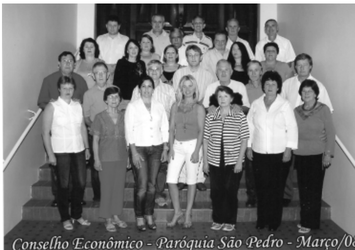
Conselho Econômico - Paróquia São Pedro - Março/08

Matriz São Pedro; Nossa Senhora do Caravágio – Bairro Esperança; Santo Expedito – Bairro Zimmer; Nossa Senhora Aparecida – Bairro São Vicente de Paulo; Nossa Senhora das Graças – Parque Lívia; Imaculado Coração de Maria – Bairro São Vicente de Paulo; Santo Antonio – Bairro Linho; Sagrado Coração de Jesus – Bairro Sagrado Coração; Nossa Senhora da Salete – Bairro Novo Horizonte; Hospital de Caridade – Missas todas as quartas-feiras às 16h; - Presídio Estadual – Missas no primeiro domingo de cada mês e celebrações do culto pela Pastoral carcerária.