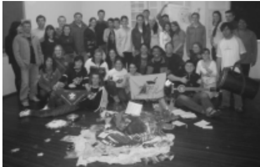
Reunião da Coordenação Regional da Pastoral da Juventude Espumoso Diocese de Cruz Alta/RS 04 a 06 de Julho