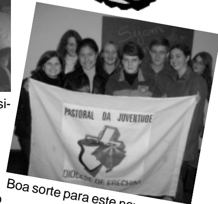
Boa sorte para este novo grupo!